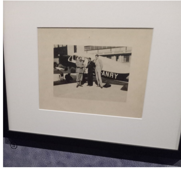
Saint-Exupéry aviateur photographie