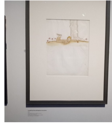
Le petit prince allongé sur le ventre, 1942, aquarelle et encre sur papier