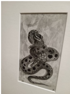
Boa dévorant un blaireau Objet d'enfance de l'écrivain Source d'inspiration du petit prince