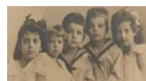
Photo d'Antoine de Saint-Exupéry avec son frère et ses sœurs, au Musée des Arts Décoratifs (Photographié par Zahra BAHHATE, mercredi 18 mai 2022)

Chaque chapitre relate une rencontre du Petit Prince qui laisse celui-ci perplexe, par rapport aux comportements absurdes « des grandes personnes ». Ces différentes rencontres peuvent être lues comme une allégorie.