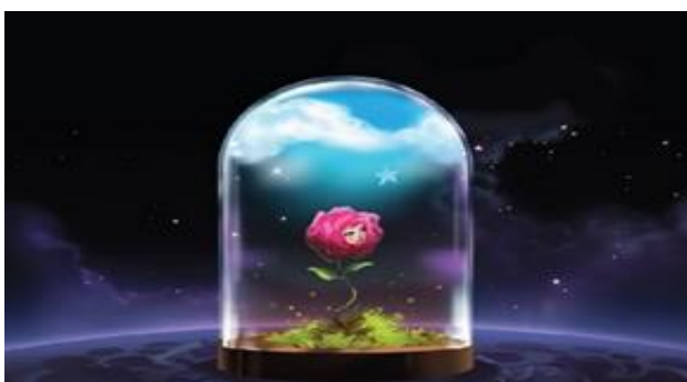
Image de la rose dans sa cloche

C'est ainsi qu'entre 1941 et 1943, à New York fut écrite l'histoire mythique du Petit Prince . Le Petit Prince fut publié juste après sa mort. Saint-Exupéry fut inspiré par sa femme Consuelo qu'il représente sous l'apparence de la fleur unique et vaniteuse du Petit Prince.