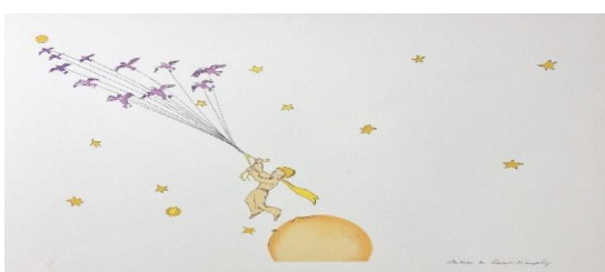
Aquarelle de Saint-Exupéry, au Musée des Arts Décoratifs (Photographié par Zahra BAHHATE, mercredi 18 mai 2022)