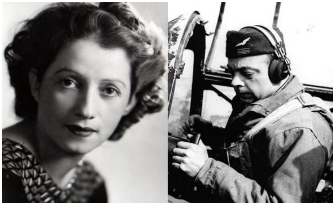
Photo de Consuelo, femme de Saint-Exupéry, Wikipédia Photo de Saint-Exupéry, aviateur, au Musée des Arts Décoratifs (Photographié par Zahra BAHHATE, mercredi 18 mai 2022)